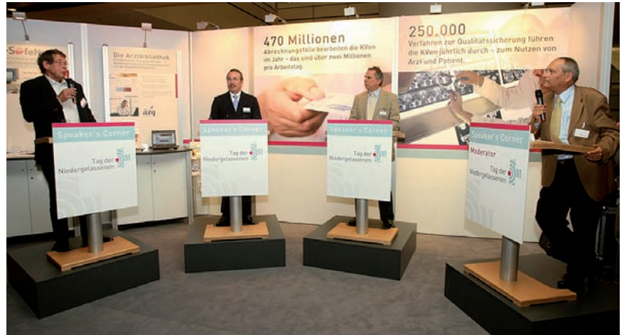
Farbe bekennen hieß es auch im Speakers' Corner 2009.