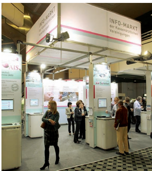
Fachleute der KVen stehen Rede und Antwort.